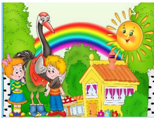
Рисунок 2 - Хорошая атмосфера

Необходимо сформировать у ребенка положительную установку, желание идти в детский сад. Это зависит в первую очередь от умения и усилий воспитателей создать атмосферу тепла, уюта и благожелательности в группе. Если ребенок с первых дней почувствует это тепло, исчезнут его волнения и страхи, намного легче пройдет адаптация. Чтобы ребенку было приятно приходить в детский сад, нужно “одомашнить” группу.